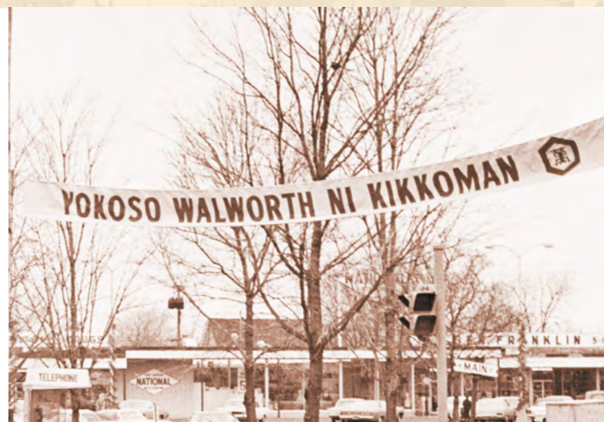
ウォルワース進出当時の写真

KFIウィスコンシン工場 SQF2000認証取得。 KFIカリフォルニア工場 SQF2000認証取得。