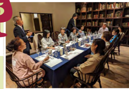
地下セラー特別室でのテイスティング