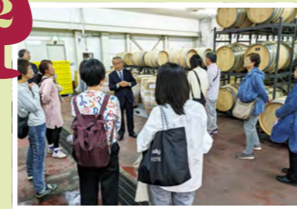
ワイン醸造所を見学