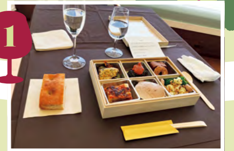
2階テラス席でのお食事