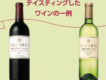
ソラリス 東山 カベルネ・ソーヴィニヨン ソラリス 千曲川 信濃リースリング クリオ・エクストラクション

ツアー当日は天候にも恵まれ、お楽しみいただけたのではと思います。今回特に人気のあった地下セラー特別室でのテイスティングなど、通常ではご体験いただけないワイナリーツアーを来年以降も予定しています。