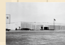
完成当時のKFIウィスコンシン工場

肉としょうゆの相性の良さを伝えるため、スーパーマーケットの店頭でしょうゆにつけた肉を焼き、試食してもらったデモンストラーションを行った。