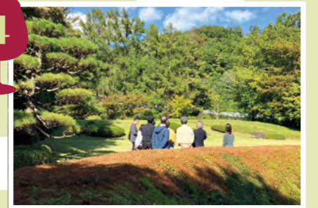
ワイナリー内にある庭園の散歩