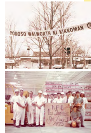
今年設立50周年を迎えるアメリカ中西部ウィスコンシン州ウォルワースのKFIウィスコンシン工場グランドオープン当時の様子

キッコーマングループの商品は100カ国以上で販売されています。アメリカに初の海外生産拠点を設立し、1973年に初出荷した時から最も大切にしていることは、地域社会との共存共栄です。できるだけ地元の企業と取引をし、現地社員の登用も積極的に行っています。また、日本人社員も、進んで地域社会と接点を持つことを心掛けています。