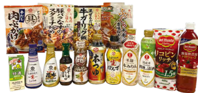
優待品一例(2026年9月お届け予定)

https://www.kikkoman.com/jp/ir/shareholder/gift.html