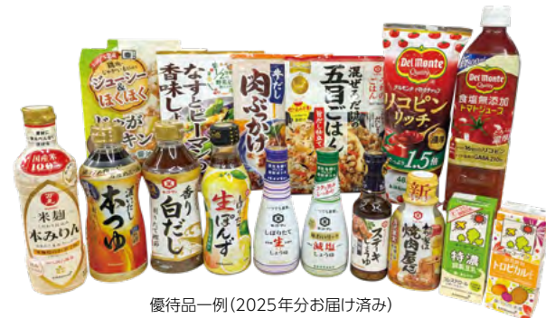
優待品一例(2025年分お届け済み)

https://www.kikkoman.com/jp/ir/shareholder/gift.html