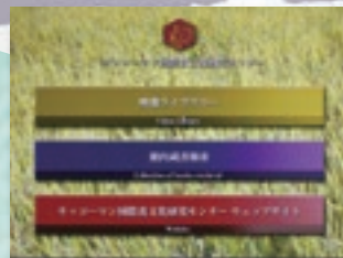
検索システムトップページ