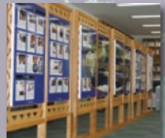
企画展示コーナー