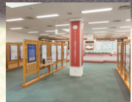
常設展示コーナー