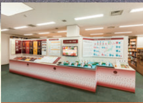
テーマ展示コーナー