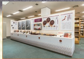
テーマ展示コーナー